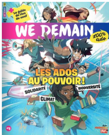
N°5 : les ados au pouvoir + le guide du rien du neuf