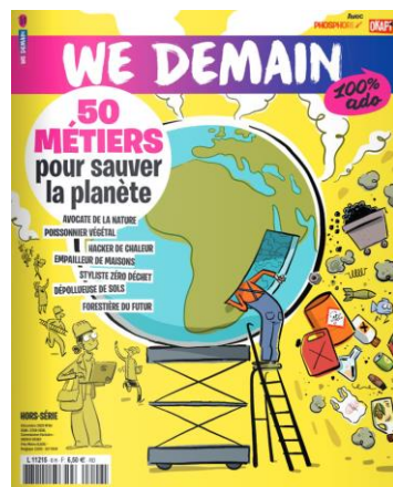
N°6 : 50 métiers pour sauver la planète