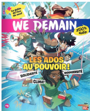
N°5 : les ados au pouvoir + le guide du rien du neuf